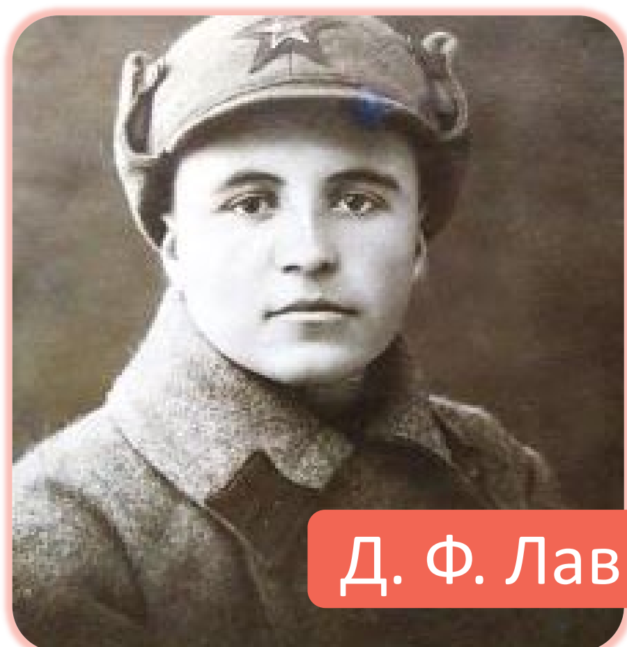
Д. Ф. Лавриненко

В его честь ежегодно проводятся военно-спортивные соревнования среди казачьей молодежи.